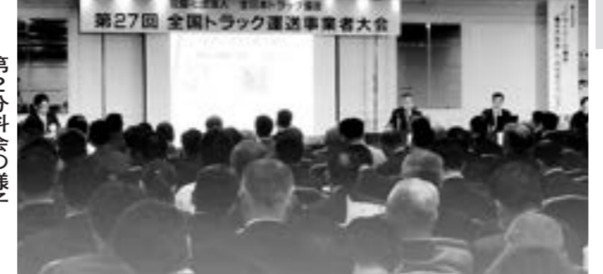
第27回 全国トラック運送事業者大会